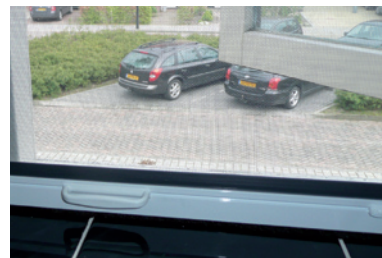
Onderlat met handgrepen