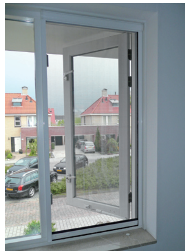
Gaspra raamrolhor (gesloten)

De raamrolhor is gemoffeld in wit (RAL 9010), crème (RAL 9001), antraciet (RAL 7016) en technisch zilver. Het gaas is grijs.